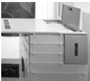
Vorratsbehälter mit komfortablem Schubdeckel auf Rollen

Im Lieferumfang enthaltenes Zubehör: Bedienungsgriff ›Kalte Hand‹, Glasreiniger, Reinigungsbürste und ausführliches Anleitungspaket