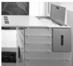
Vorratsbehälter mit komfortablem Schubdeckel auf Rollen