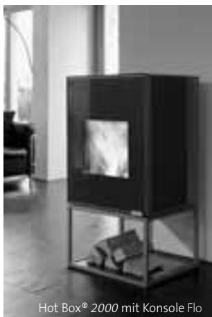
Hot Box® 2000 mit Konsole Flo