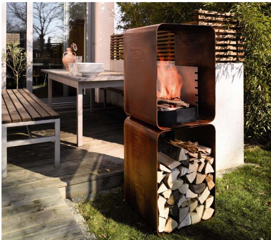
Vereint Feuerstätte und Grill in einem: das wodtke Feuermodul Gryll .

Bildmaterial senden wir Ihnen auf Wunsch gerne zu. Bitte nehmen Sie mit uns Kontakt auf.