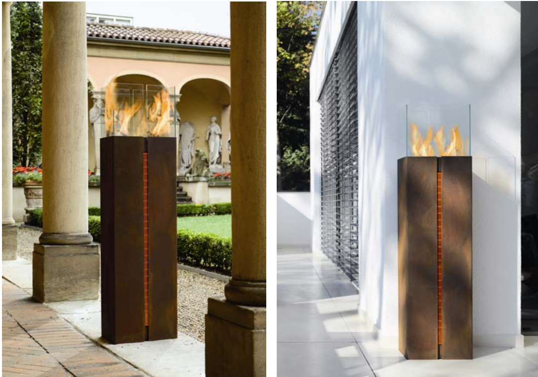
wodtke Feuerskulptur Tuto : Korpus aus gerostetem Stahl, Windschutz aus Glas, Trennfuge Acrylglas – reizvolle Gegensätze, die in jeder Garten- und Terrassenatmosphäre für lebendiges Feuer sorgen.