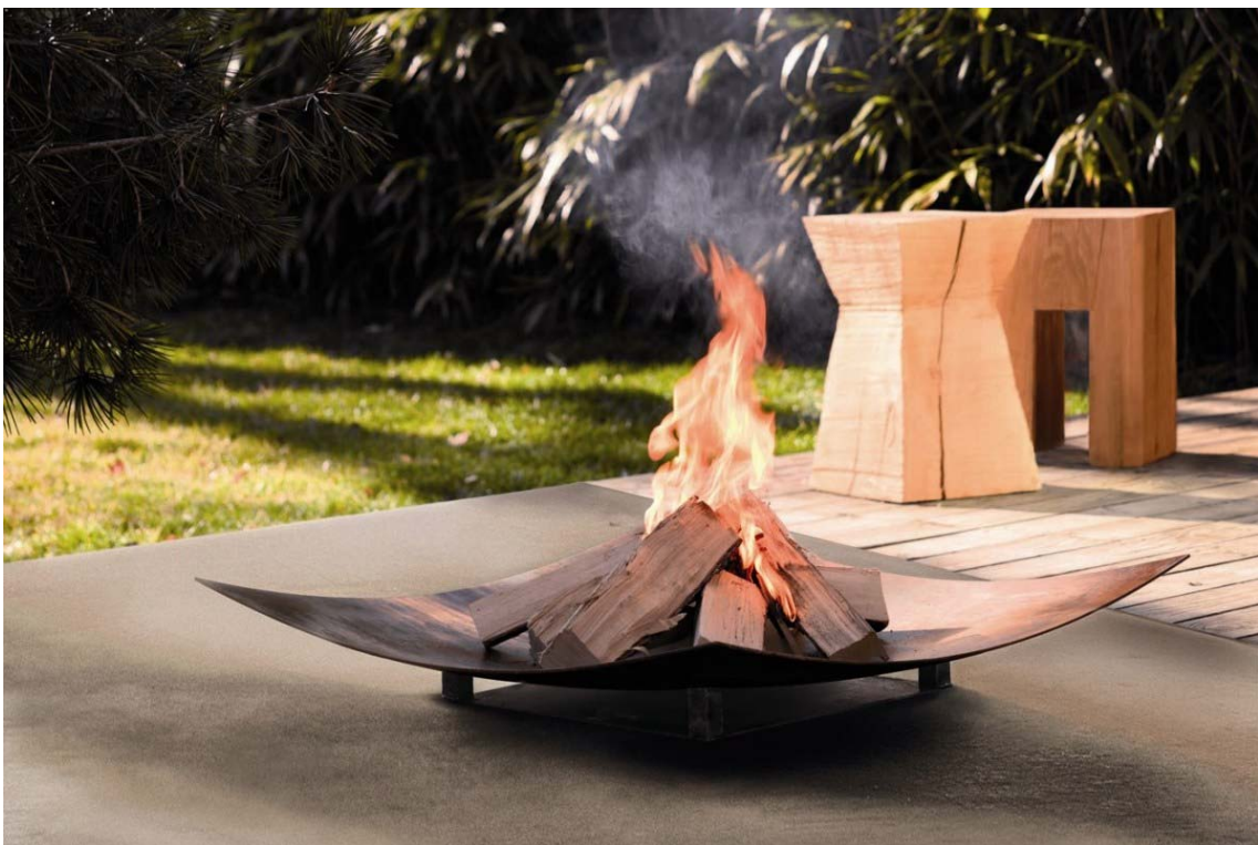
wodtke Feuerschale Wing - offenes Feuer im Freien elementar und pur genießen!