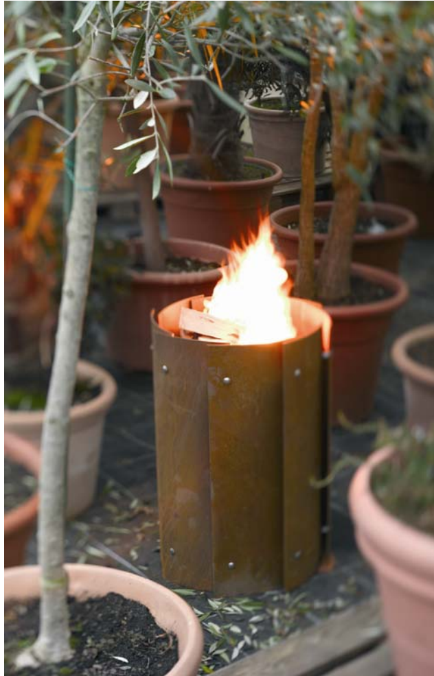
wodtke Bronx - das Fire feeling aus der Tonne - eine Feuerrotunde mit raffinierter, fächerförmiger Konstruktion.