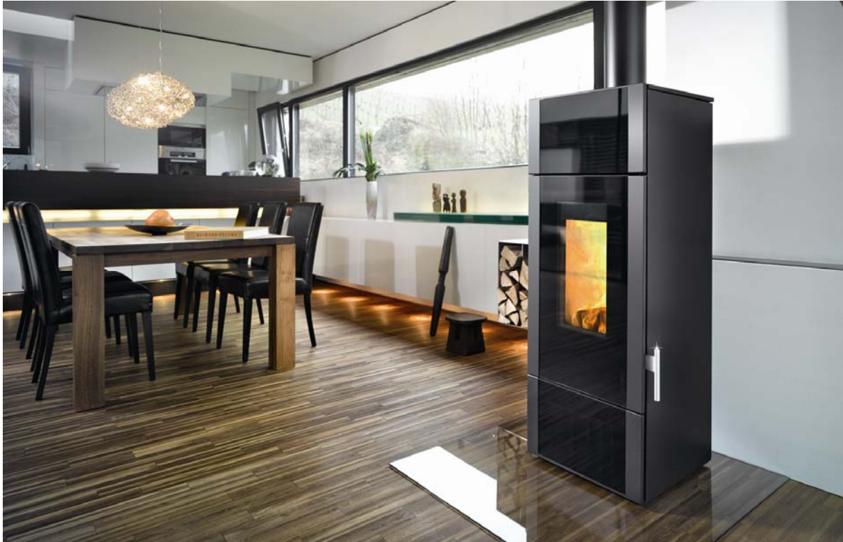
wodtke Kaminofen Giro — mit integriertem Wasserwärmetauscher zur Wohnraumaufstellung — mit raumluftunabhängiger Luftzufuhr.