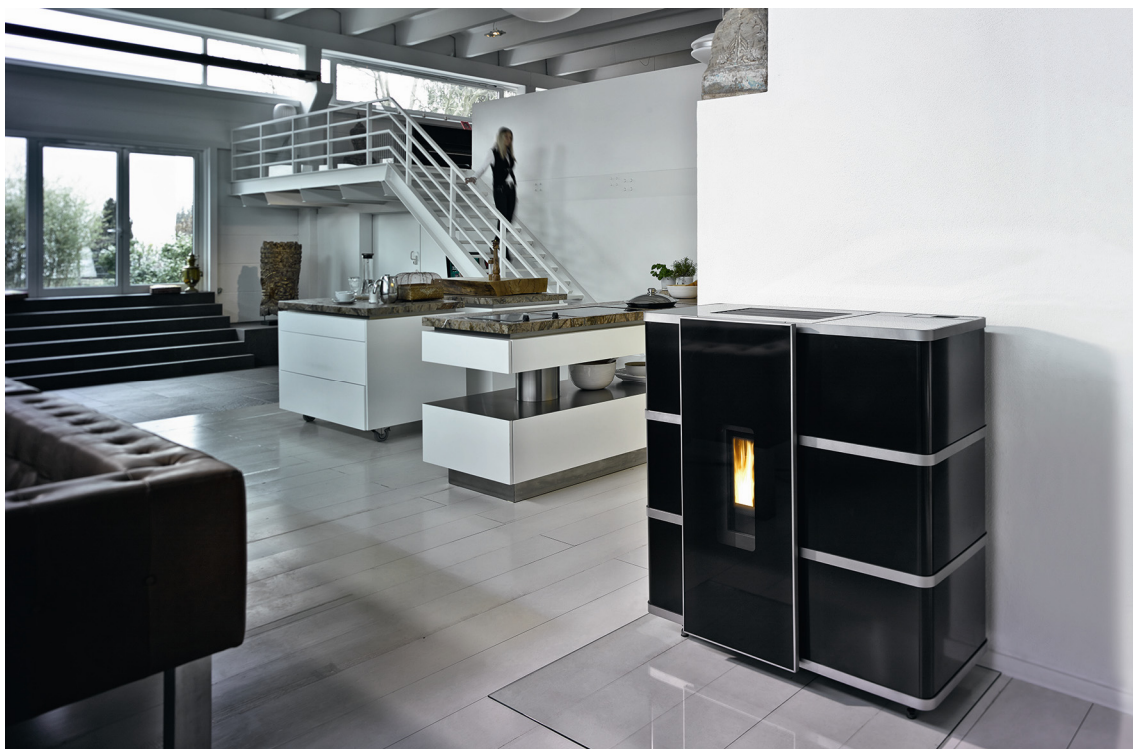
wodtke ixpower avec wodtke eReserve – cette réserve de sécurité intégrée permet de compenser les pannes de courant pendant près de 24 heures.