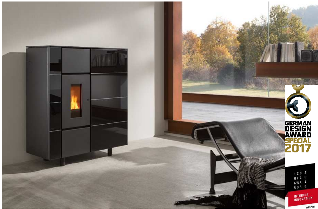
wodtke Pellet Primärofen Ultra-Linie , Modellreihe ixbase : Lebenskomfort und Wohlfühlwärme mit der Technik der Zukunft. Die Nennwärmeleistung beträgt 5 bzw. 6 kW, der Einstellbereich 2 - 5 bzw. 6 kW; optional ausgestattet mit der wodtke eReserve.