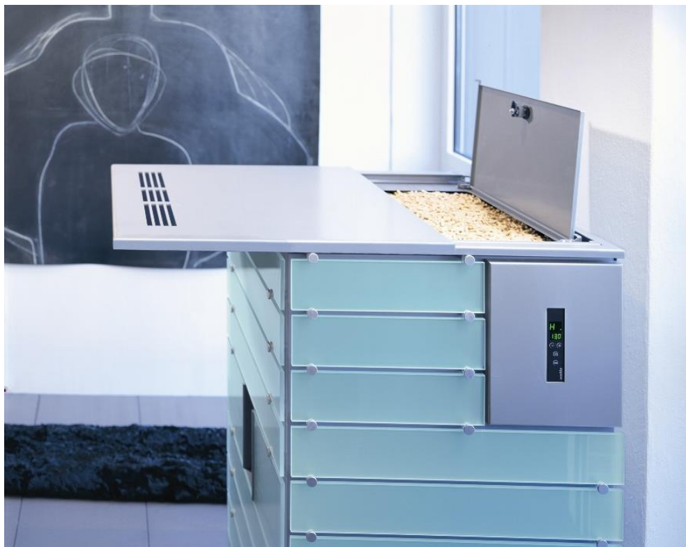
wodtke Pellet Primärofen ivo.tec mit Glas-Dekor „transparent grün“ Eingetragenes Design