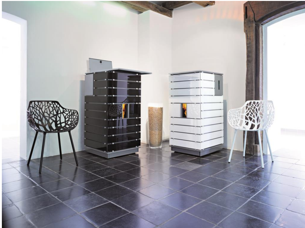
wodtke Pellet Primärofen ivo.tec mit Glas-Dekor „black“ und „white“

Die wodtke Pellet Primärofen-Technik – gut für den Menschen und gut für die Umwelt.