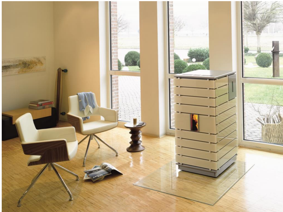
wodtke Pellet Primärofen ivo.tec mit Glas-Dekor „Latte M“