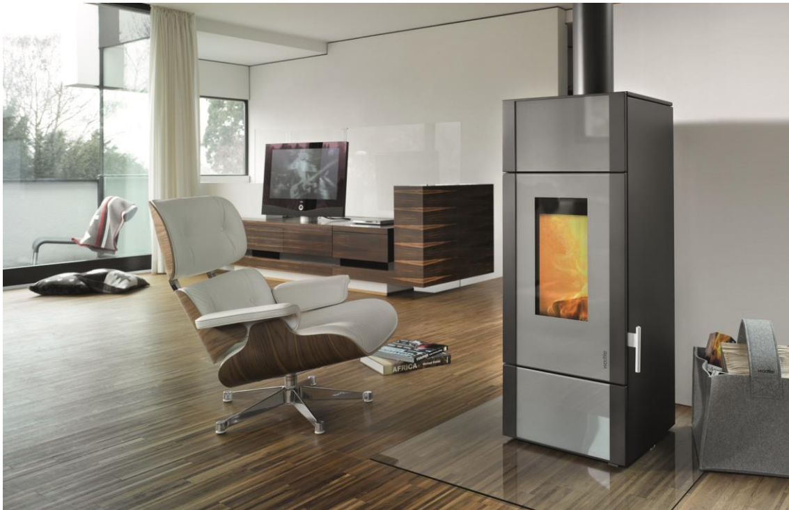
wodtke Kaminofen Giro water+ – mit integriertem Wasserwärmetauscher zur Wohnraum- aufstellung – mit raumluftunabhängiger Luftzufuhr.