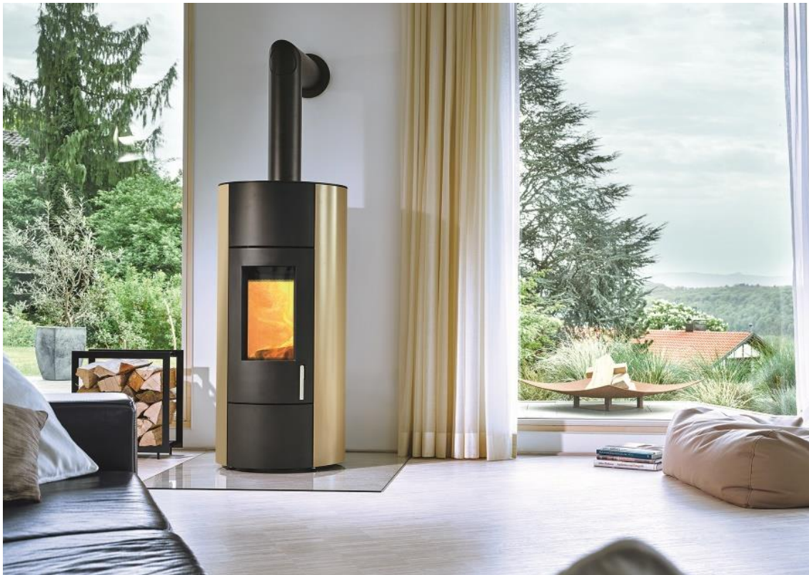
wodtke Kaminofen CEO water+ für die Anbindung an das Zentralheizungssystem – in Seitenverkleidung sahara (Bild), black, white oder red.