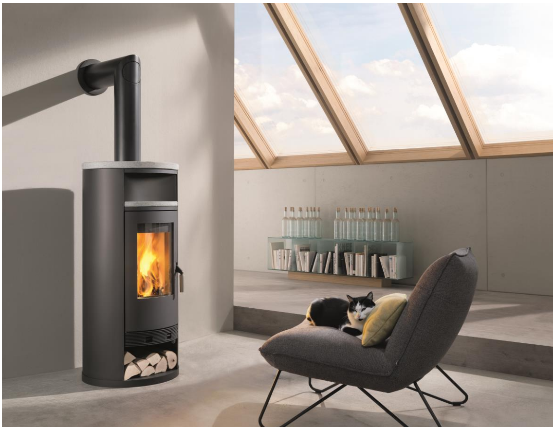
wodtke Kaminofen Momo water+ mit Speckstein-Dekorplatte - für die Anbindung an das Zentralheizungssystem. MOMO - unser TOPSELLER 2023.