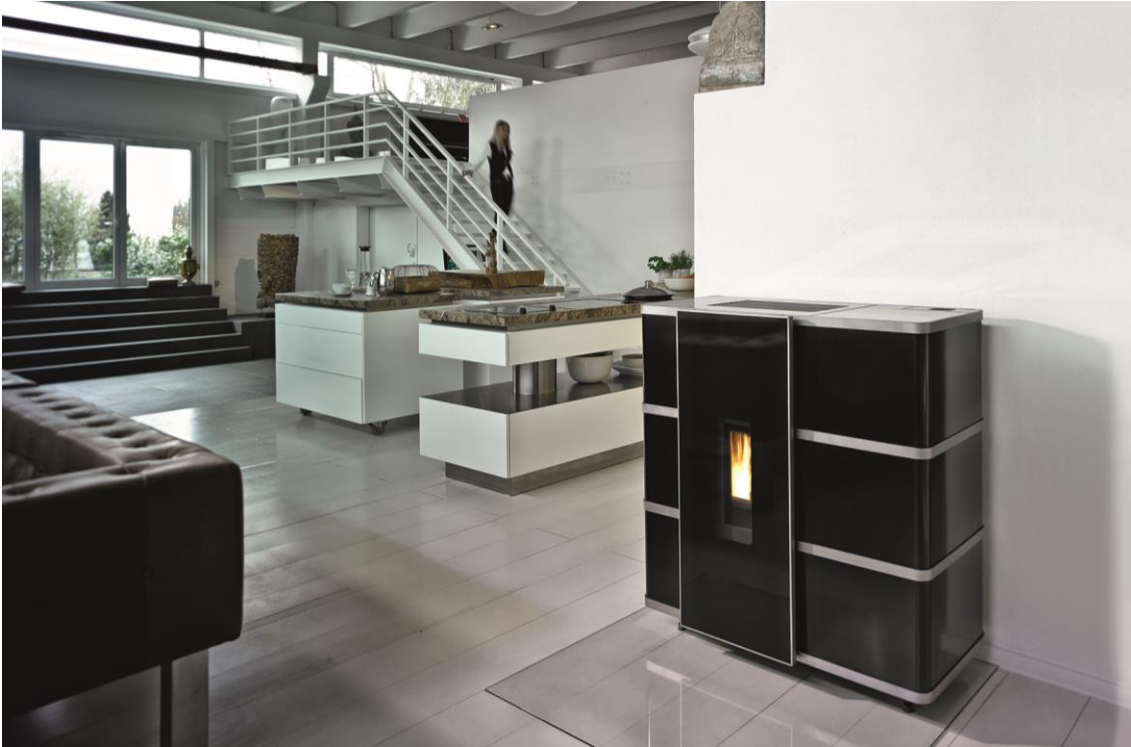
wodtke ixpower mit wodtke eReserve – mit dieser integrierten Sicherheitsreserve können Stromausfälle bis zu 24 Betriebsstunden überbrückt werden.