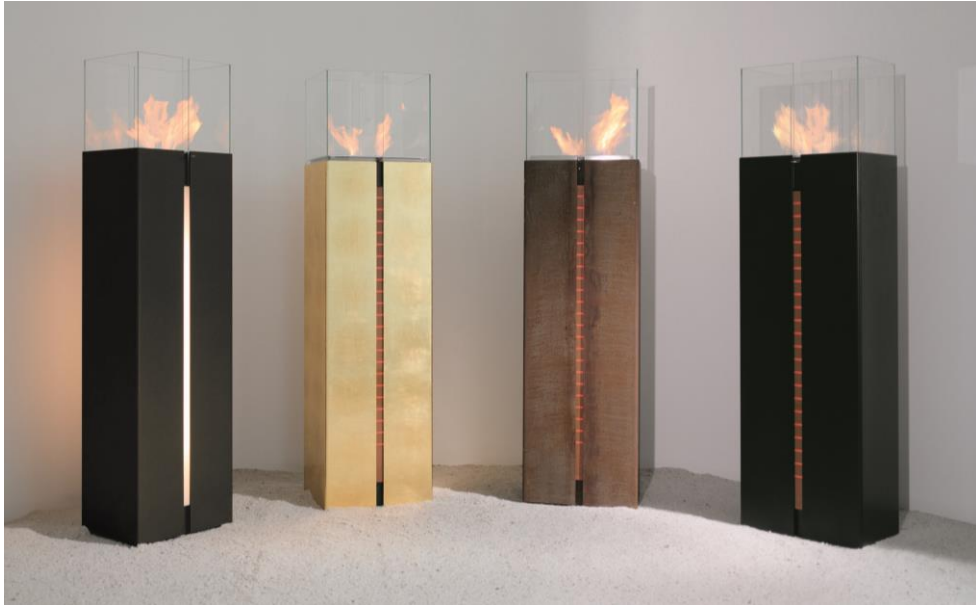
Das Feuerobjekt wodtke Tuto für Bio-Ethanol - faszinierende Feuer- und Lichtspiele. V.l.n.r.: Tuto bronze indoor mit integriertem LED-Modul; Tuto gold indoor, special edition; Tuto rost outdoor; Tuto black indoor.