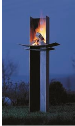
wodtke Feuerskulptur Manitu – hoher ästhetischer Anspruch und archaische Ausdruckskraft.