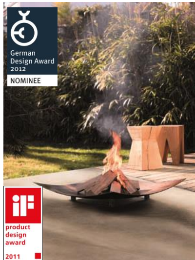
Die wodtke Feuerschale Wing – offenes Feuer im Freien elementar und pur genießen!