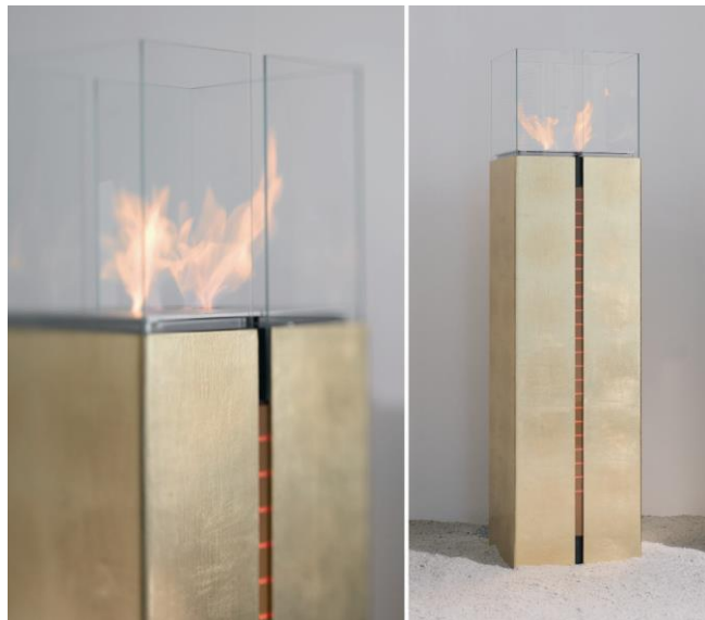
Als special edition das absolute Highlight: Tuto gold - echt blattvergoldet - jedes Objekt extra gefertigt.