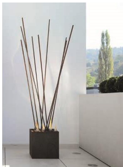
Die wotdke Ethanol Stabskulptur Stix : fünf Aluminium-Fackeln und neun bewegliche Stahlstäbe, dazu 49 Aussparungen im Korpus aus gerostetem Stahl – Garanten für unendlich viele variierende Feuererlebnisse im Freien.