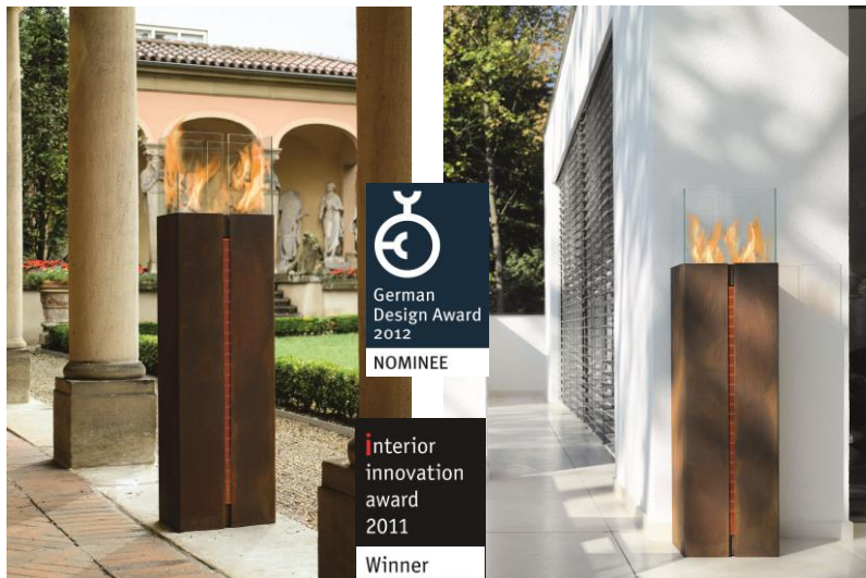
Die wotdke Ethanol Design-Feuerskulptur Tuto : Korpus aus gerostetem Stahl, Windschutz aus Glas, Trennfuge Acrylglas – reizvolle Gegensätze, die in jeder Garten- und Terrassenatmosphäre für lebendiges Feuer sorgen.