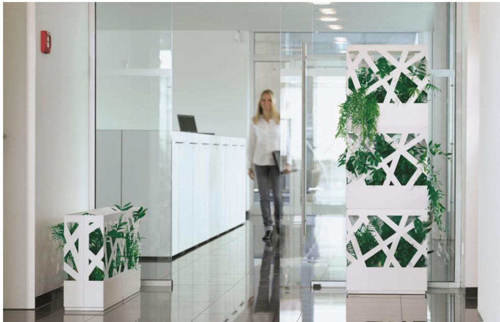
wodtke Jardinière ist stapelbar – bis zu drei Einzelelemente übereinander und beliebig viele nebeneinander bilden mit dem fortlaufenden horizontalen Design ein organisches Objekt