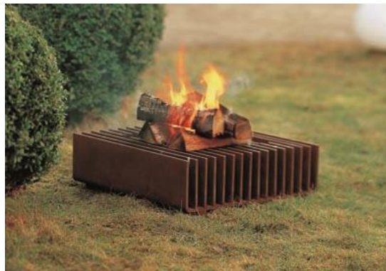
Der wodtke Gartenrost feuer.werk .

Bildmaterial senden wir Ihnen auf Wunsch gerne zu. Bitte nehmen Sie mit uns Kontakt auf.