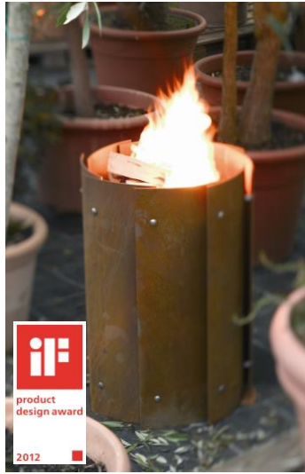
wodtke Bronx - das Fire feeling aus der Tonne - eine Feuerrotunde mit raffinierter, fächerförmiger Konstruktion.