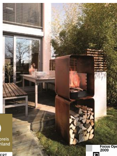
Vereinen Feuerstätte und Grill in einem: die wotdke Feuerskulptur Cruso (l.) und das wotdke Feuermodul Gryll (r.)