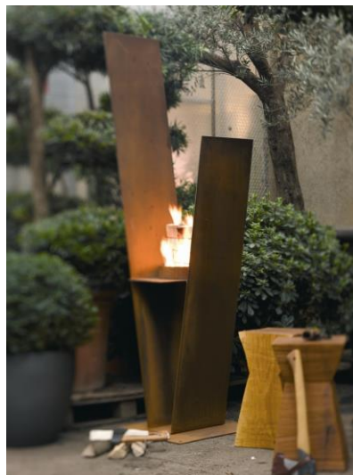
wodtke Camp - die Feuerstele für eindrucksvolle Abenteuer im heimischen Garten - schlank aufragende Stahlplatten inszenieren das Feuer.