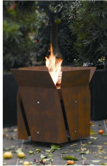
wodtke Favi - ein kompakter Kubus mit großflächiger Feuerstelle. Abgewinkelte Stahlfächer bilden den praktischen Windschutz.