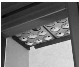
HiClean-Filter® Technik (HCF 02)