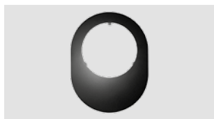
Art.-Nr.: 092 098