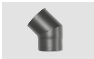
Art.-Nr.: 093 092