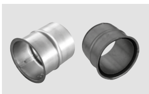
Wandfutter Ausführung: einfach Wandfutter Ausführung: doppelt