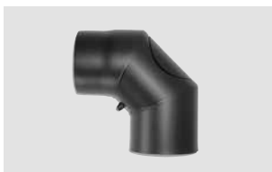
Art.-Nr.: 093 091