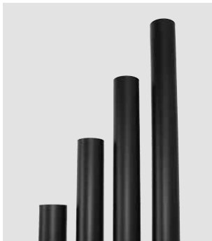
Art.-Nr.: 010 020 – 010 025

01.07.2020 - 31.12.2020 Vorübergehende Senkung der MwSt. in Deutschland auf 16%.