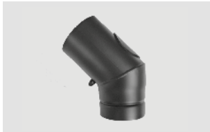
Art.-Nr.: 010 051

* Ø 100 Rauchrohre und -bögen inkl. Dichtring. Für wotdke Kaminöfen nur als Verbrennungsluftleitung einsetzbar.