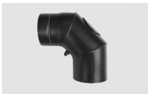
Art.-Nr.: 010 039