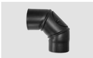
Art.-Nr.: 093 095