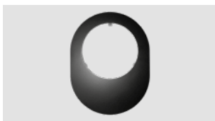
Art.-Nr.: 092 098