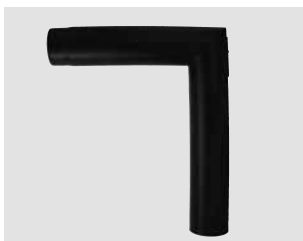
Art.-Nr.: 093 093