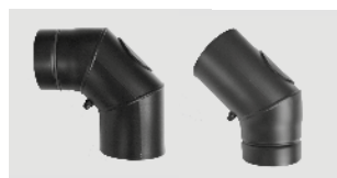
Art.-Nr.: 010 039