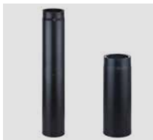
Art.-Nr.: 013 054 - Bild links