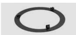
Art.-Nr.: 013 057