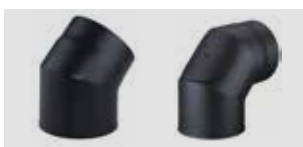
Art.-Nr.: 013 051 - Bild links Art.-Nr.: 013 039 - Bild rechts