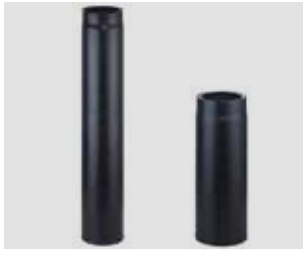
Art.-Nr.: 013 054 - Bild links Art.-Nr.: 013 050 - Bild rechts

01.07.2020 - 31.12.2020 Vorübergehende Senkung der MwSt. in Deutschland auf 16%.