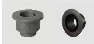
Art.-Nr.: 012 058 - Bild links Art.-Nr.: 013 052 - Bild rechts