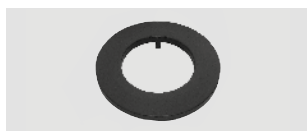
Art.-Nr.: 010 052