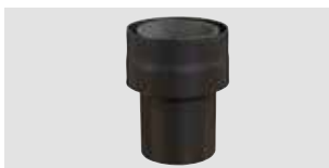
Art.-Nr.: 013 055