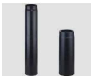
Art.-Nr.: 013 054 - Bild links Art.-Nr.: 013 050 - Bild rechts