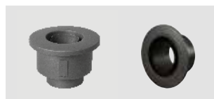
Art.-Nr.: 012 058 - Bild links Art.-Nr.: 013 052 - Bild rechts