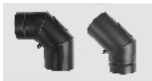
Art.-Nr.: 010 039 Art.-Nr.: 010 051