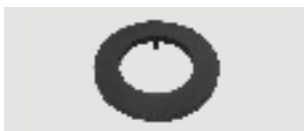
Art.-Nr.: 010 052

* Vorgesehen für den Anbau an horizontal verlegte Rauchrohre bei wodtke Pellet Primärofen mit Ø 100 mm. Die Befestigung erfolgt mittels mitgelieferter Schellen.