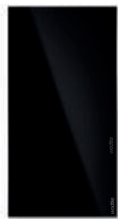
IR B 900