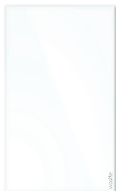
IR W 700