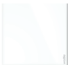
IR W 300