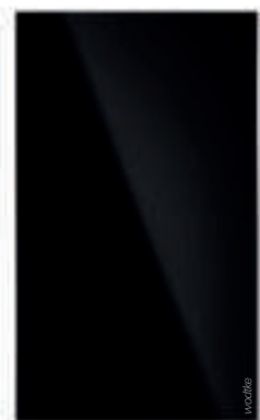
IR B 700