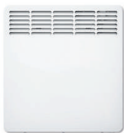
warming comfort S