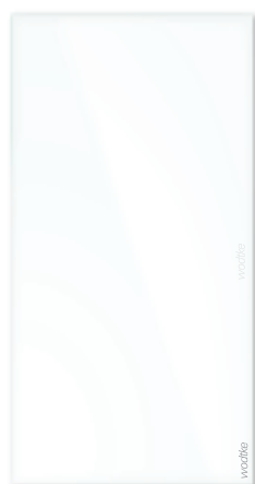
IR W 900