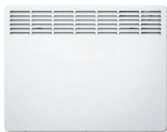
warming comfort M