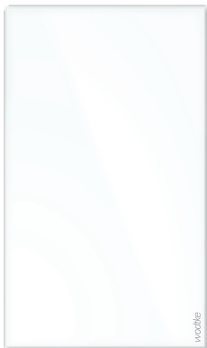
IR W 700

Einfache und stabile Wandmontage durch nur eine Person. Wandhalterung wird getrennt angebracht, danach muss das Gerät nur eingehängt und gegebenenfalls justiert werden.