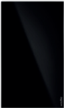
IR B 700