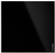
IR B 300 ›black‹

01.07.2020 - 31.12.2020 Vorübergehende Senkung der MwSt. in Deutschland auf 16%.