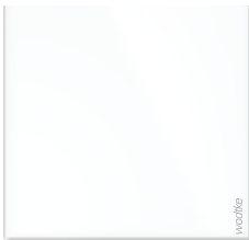
IR W 300 ›white‹