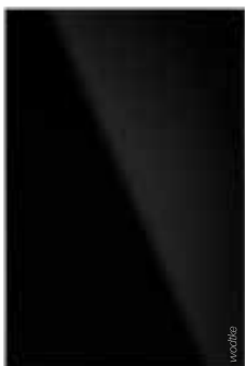
IR B 500 ›black‹

01.07.2020 - 31.12.2020 Vorübergehende Senkung der MwSt. in Deutschland auf 16% .