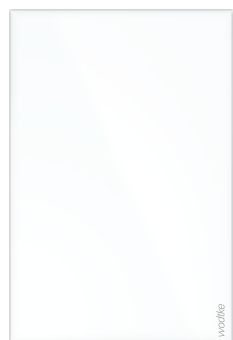
IR W 500 ›white‹