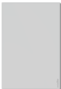
IR C 500 ›café-melange‹