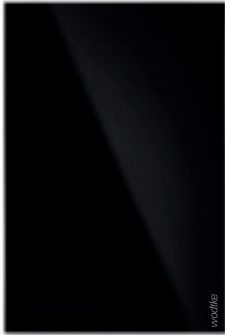
IR B 500 ›black‹