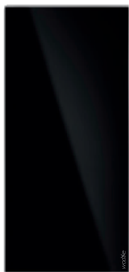
IR B 700