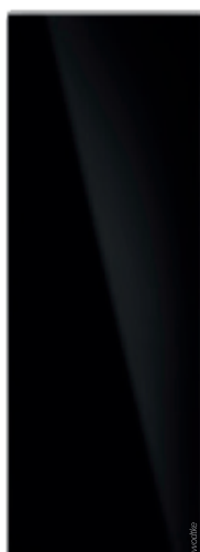
IR B 900