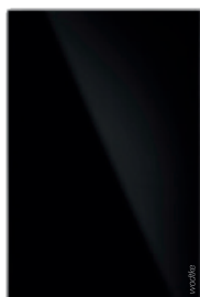
IR B 500